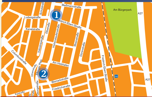
1 Hohenstaufenstraße 35, 27570 Bremerhaven 2 Elbinger Platz 1, 27570 Bremerhaven