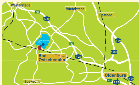
Am Rosenteich 26 26160 Bad Zwischenahn Erreichbar: A 28 bis Ausfahrt Bad Zwischenahn